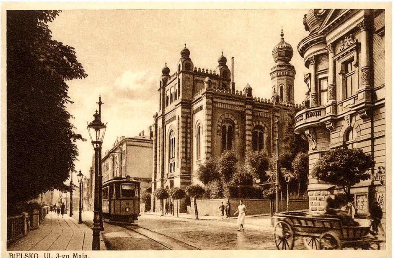
BIELSKO. Ul. 3-go Maja.