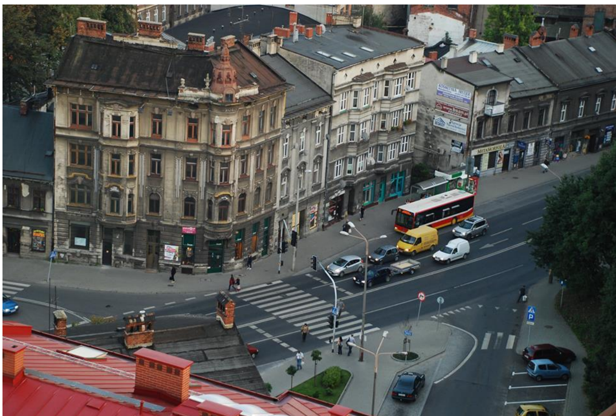
Fotografie Bielska, autor: Michał Bąk